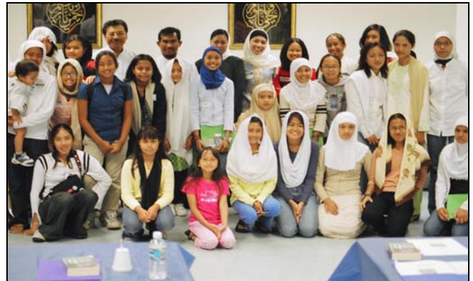
Foto acara Pesantren Kilat September 26-27, 2003

Bidang sosial akan berusaha untuk mengadakan pengumpulan dana infak dan sadaqah, zakat fitrah dan harta. Rencana lain adalah program "Peduli Indonesia", yaitu pengumpulan barang-barang yang hasilnya akan dikirimkan ke Indonesia. Kemungkinan kegiatan ini akan dilakukan di sekitar bulan Ramadhan.