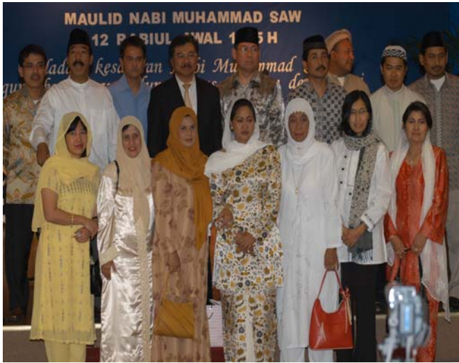
Foto Bersama Konsul Jendral RI bersama Tokoh-tokoh Masyarakat

Bagi umat Islam Indonesia, memperingati hari kelahiran Nabi Muhammad SAW merupakan suatu kewajiban kultural. Umat Islam secara tradisional merasa berkewajiban untuk merayakan hari kelahiran Nabi Muhammad SAW atau yang lebih dikenal dengan nama Maulid Nabi. Peringatan Maulid Nabi ini diselenggarakan dengan berbagai cara. Pada contohnya, banyak pihak mengadakan pengajian di mesjid dengan mengundang penceramah atau tokoh agama yang membahas tentang kisah dan sejarah Nabi Muhammad SAW, terutama akhlak dan kepemimpinan beliau yang sangat perlu diteladani.