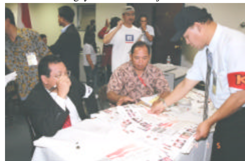
Hirup Pikuk Perhitungan Suara