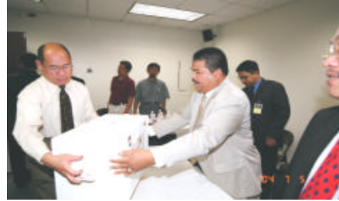
Serah Terima Suara dari KPPSLN 1 kepada PPLN