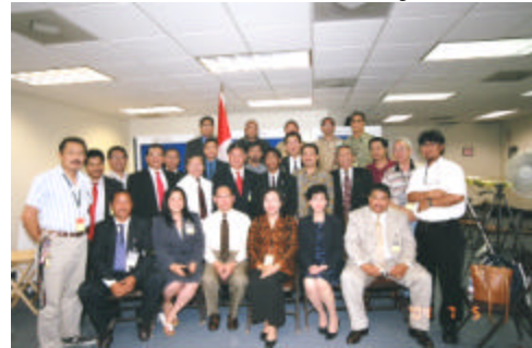
Bergaya Setelah Bekerja Keras